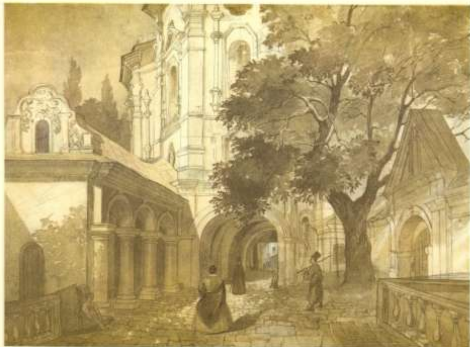
144. ЦЕРКВА ВСІХ СВЯТИХ У КИЄВО-ПЕЧЕРСЬКІЙ ЛАВРИ. Сєвєк. [IV—IX 1846].