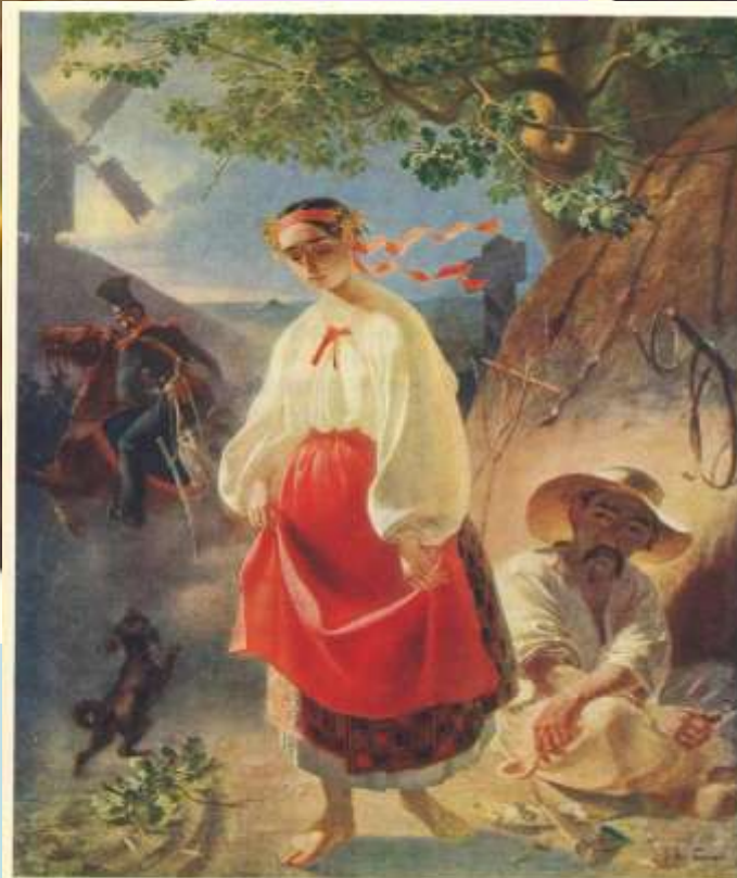
М. КАТЕРИНА Katepina, 1842.