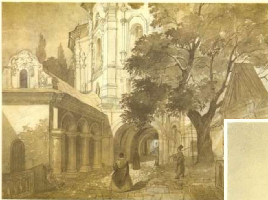
144. ЦЕРКВА ВСІХ СВЯТИХ У КИЄВО-ПЕЧЕРСЬКИХ ЛАВРІ. Євста. [IV—IX 1846].