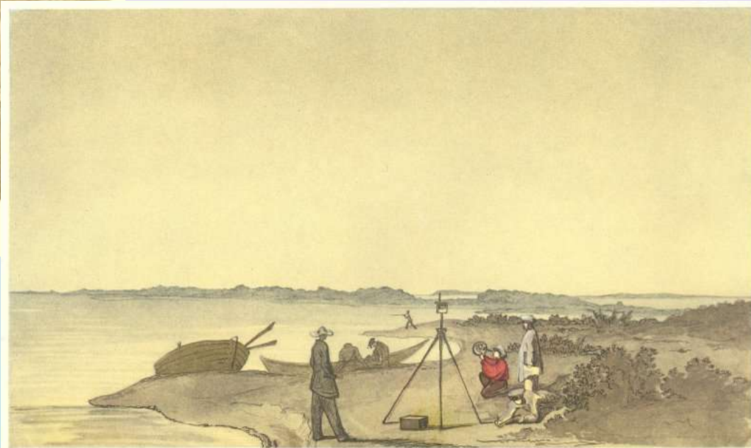
30. Т. Г. ШЕВЧЕНКО СЕРЕД УЧАСНИКІВ ЕКСПЕДИЦІЇ НА БЕРЕЗІ АРАЛЬСЬКОГО МОРЯ. Акварель. [12—21.IX 1848; 22—30.VIII 1849].