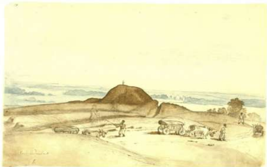
135. КОЛО СЕДНЕРА. Трої, сєвєк, олександр. [IV 1846].