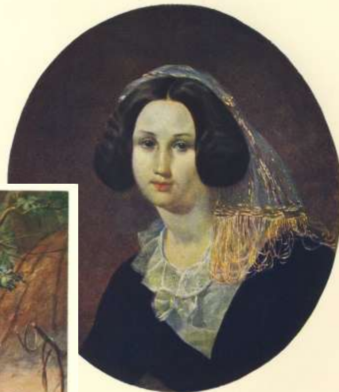
Е. В. КЕРЯТОРОВ Dais, [Киев III—IV] 1847.