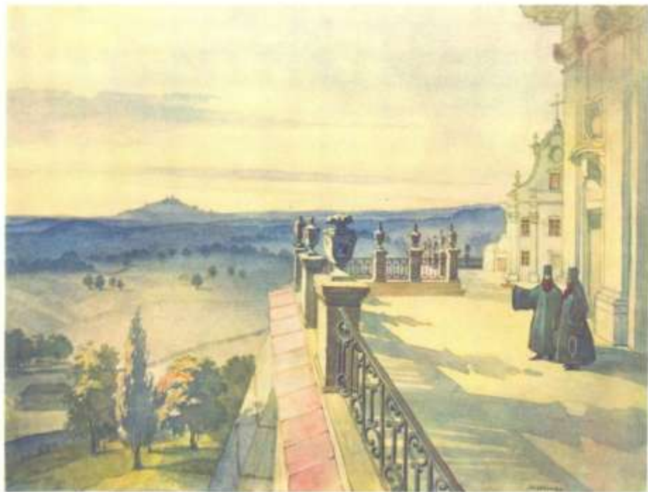
131. ВІД НА ОКОЛИЦІ З ТЕРАСИ ПЕЧАЇВСЬКОЇ ЛАВРИ. Алєксєєв. [X 1846].