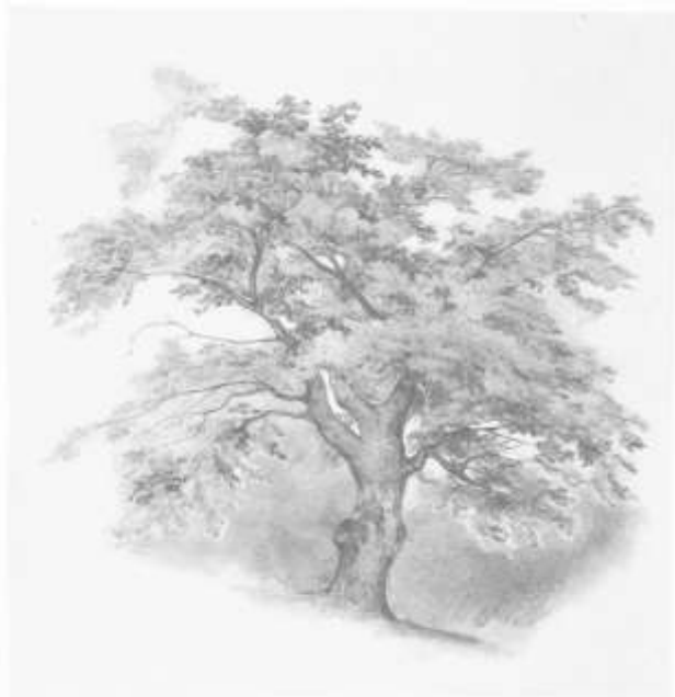
180. ДЕРЕВО. Олівець. (IV 1843—квітень 1844).