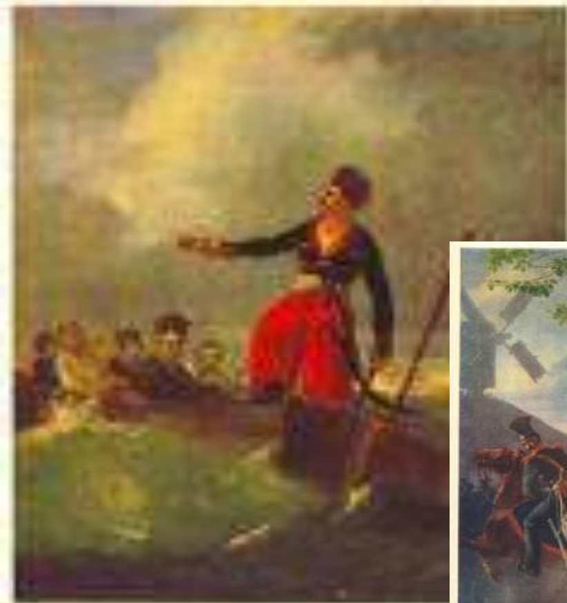
И. ЛЕРМОНОВ Танец, 1841.