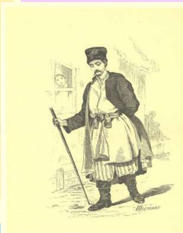
34. ЗНАХАР. Ілюстрація до однойменного твору Г. Ф. Квітки-Основицької. Гравюра на дереві [Н. н. 10.X 1841].