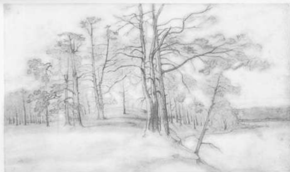
181. УСАДЬБА. Олівець, акварель. (IV 1845—III 1847).