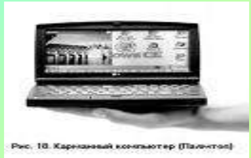
Рис. 18. Карманный компьютер (Планітас)